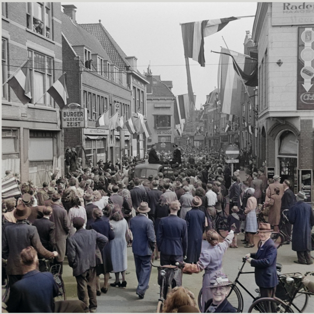
Adolf Hitler wordt rijkskanselier van Duitsland.